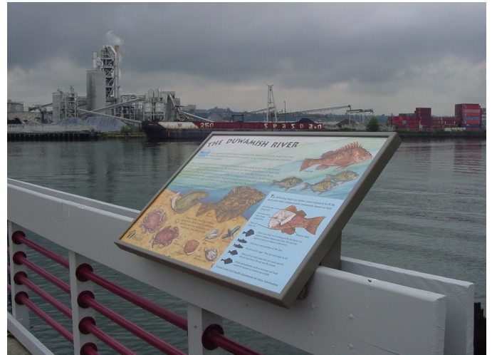
Bảng khuyến cáo tiêu thụ hải sản Sông Duwamish tại Trạm 105

Cá và Hải Sản Vỏ Cứng Quan ngại lớn nhất về sức khỏe và lối tiếp xúc chính với các chất ô nhiễm trong