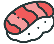
전문적인 프로세스 사용