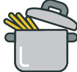
조리된 음식 식히기