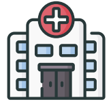
매우 취약한 인구군에게 서비스 제공